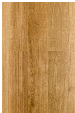
P131 Chêne Natur