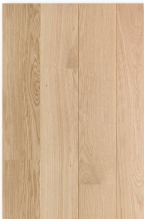
P122 Chêne Aube