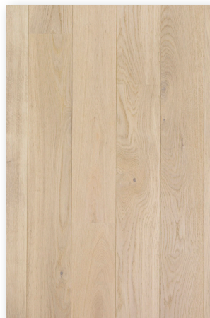
P132 Chêne Nuage