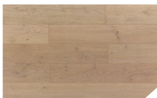
P132 Chêne blanchi *