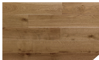
P157 Chêne monarque *