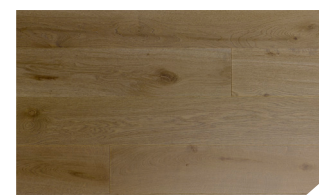
P169 Chêne opale *