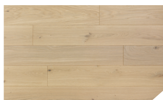
P078 Chêne Dune **