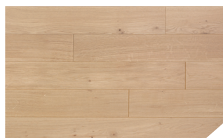
P122 Chêne aurore *