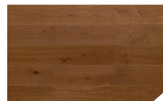
P168 Chêne cuir *