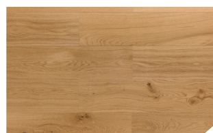
P167 Chêne havane *