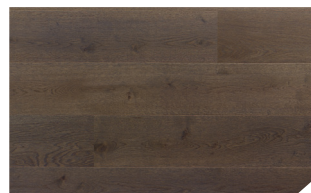
P158 Chêne Acier *