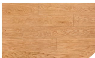
P068 Chêne Naturel **