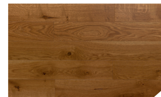
P300 Chêne safari *