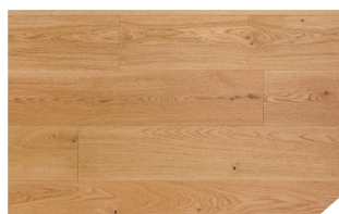
P131 Chêne Naturel *