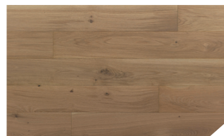
P152 Chêne Mervent *