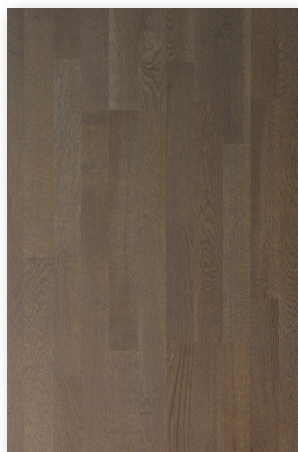
P158 Stone Nuancé