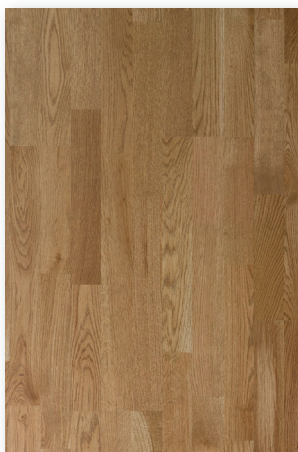
P157 Eminence Nuancé