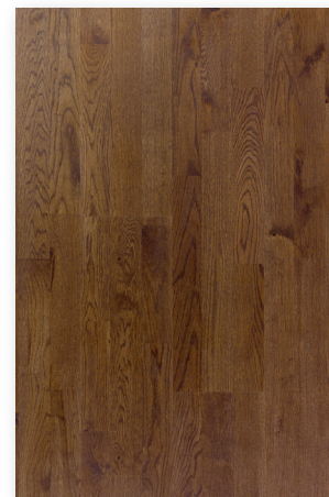
P135 Chestnut Nuancé