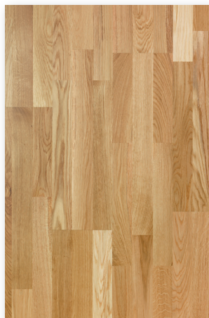
P131 Chêne Natur Nuancé