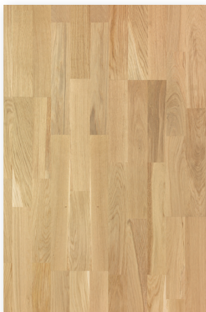
P122 Chêne Aube Nuancé