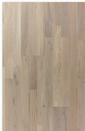
P132 Chêne Nuage Nuancé